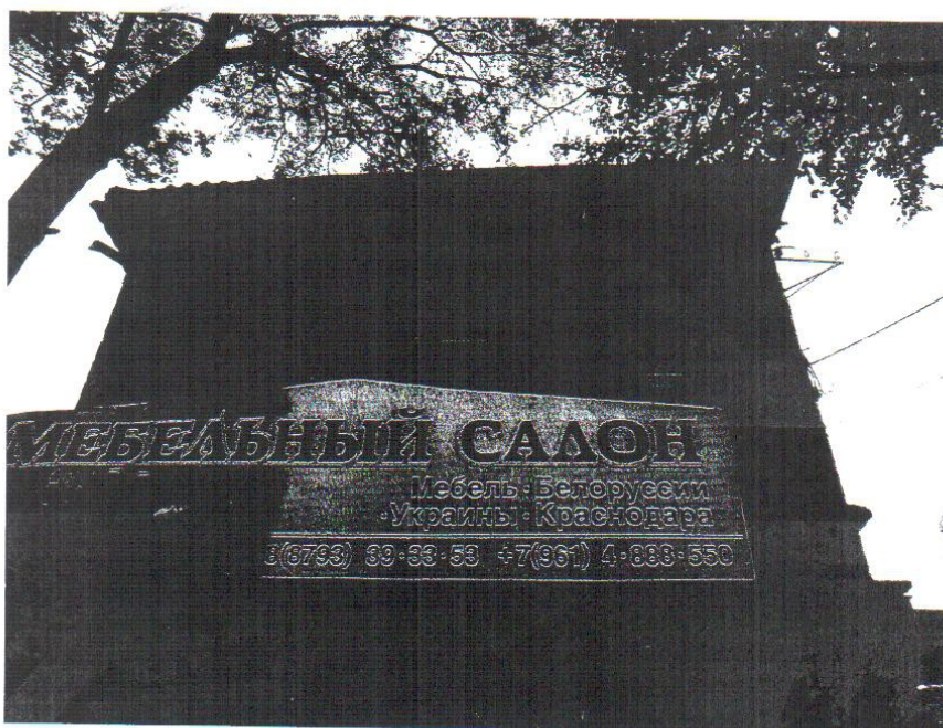
Вид на второй этаж