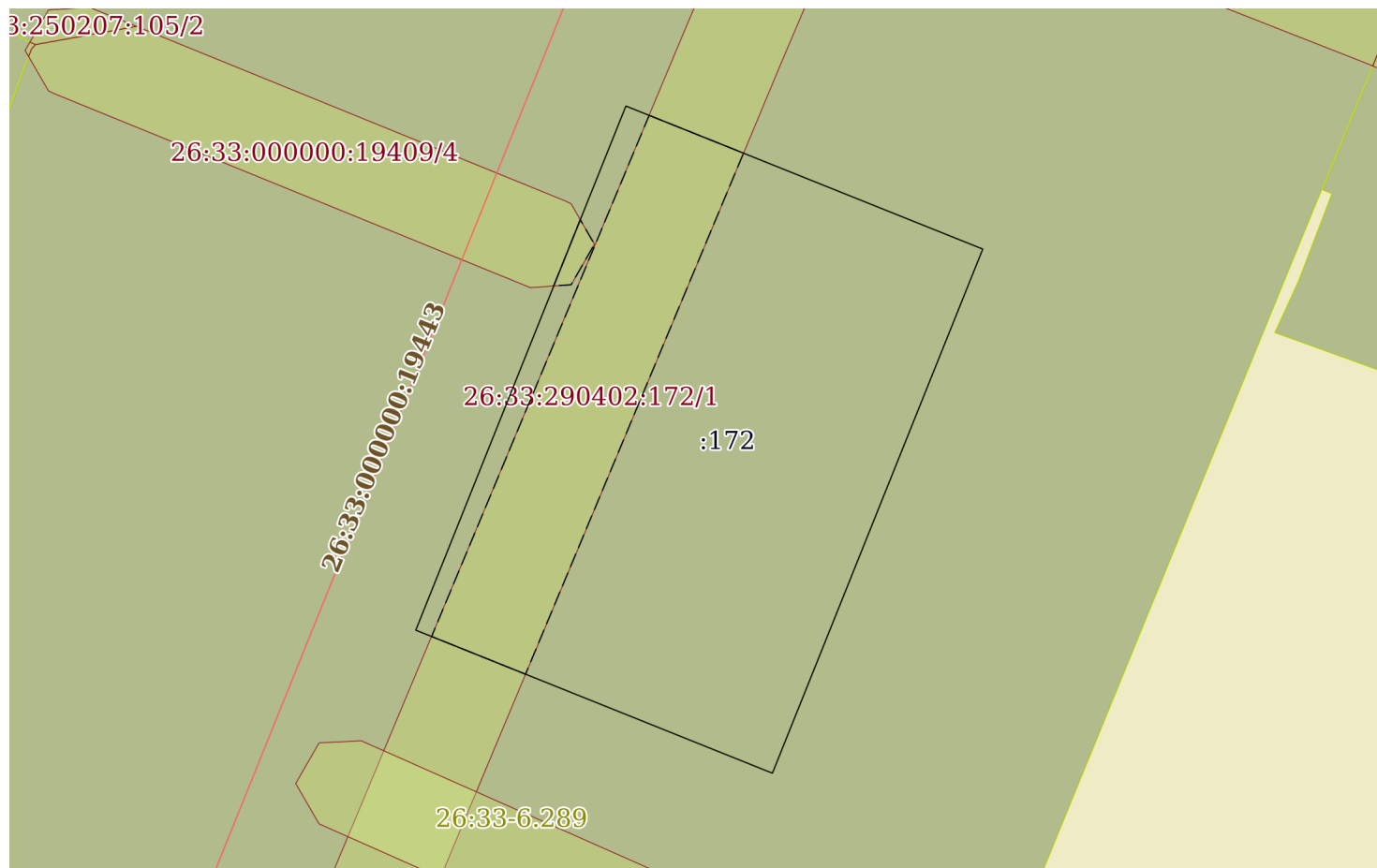
План (чертеж, схема) земельного участка