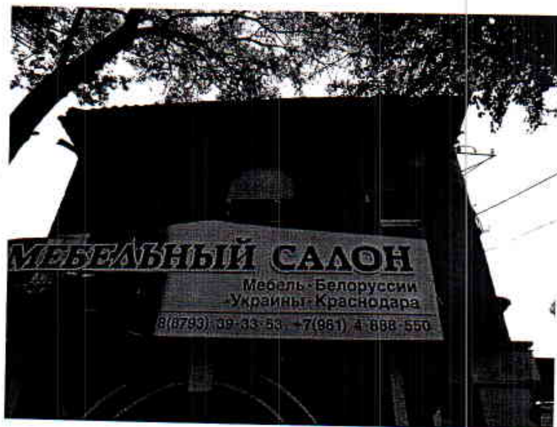
Вид на второй этаж