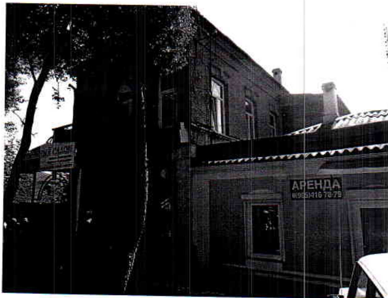
Общий вид памятника